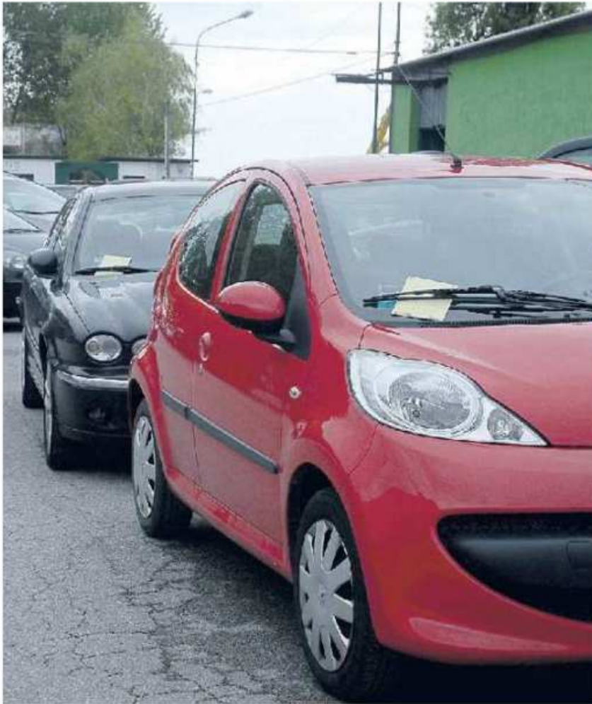
SANZIONI La riscossione delle multe implica un lavoro poliennale